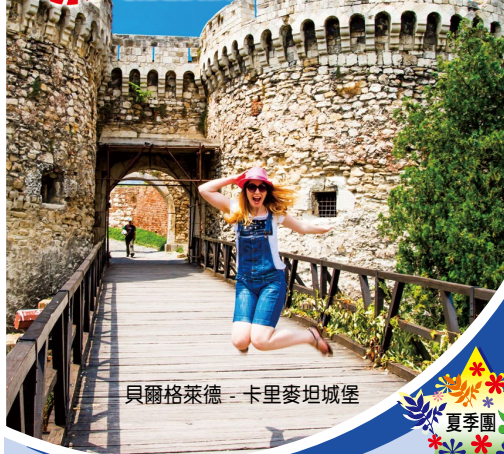
貝爾格萊德 - 卡里麥坦城堡